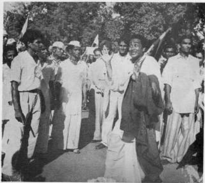
दिंडी सत्याग्रह - रस्त्यारस्त्यार पहाडी तान - अशी गाजवली दिल्ली