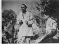
They are the people who are the backbone of the nation.