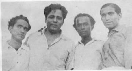
ते चौघे मित्र