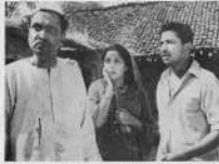
They are the people who are the backbone of the nation.