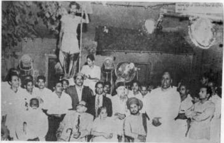
'महात्मा फुले' चित्रपटाच्या मुहूर्तप्रसंगी : अमर शेख, सेनापती बापट, कर्मवीर भाऊराव पाटील, बाबासाहेब आंबेडकर, सौ० सविता आंबेडकर, बाबूराव पेंडारकर आणि आचार्य अत्रे एक दुर्मिळ, अविस्मरणीय क्षण!