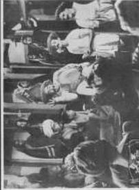
They are the people who are the backbone of the nation.