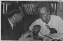
विद्यादेवी और जयशंकर : श. जयशंकर प्रसाद