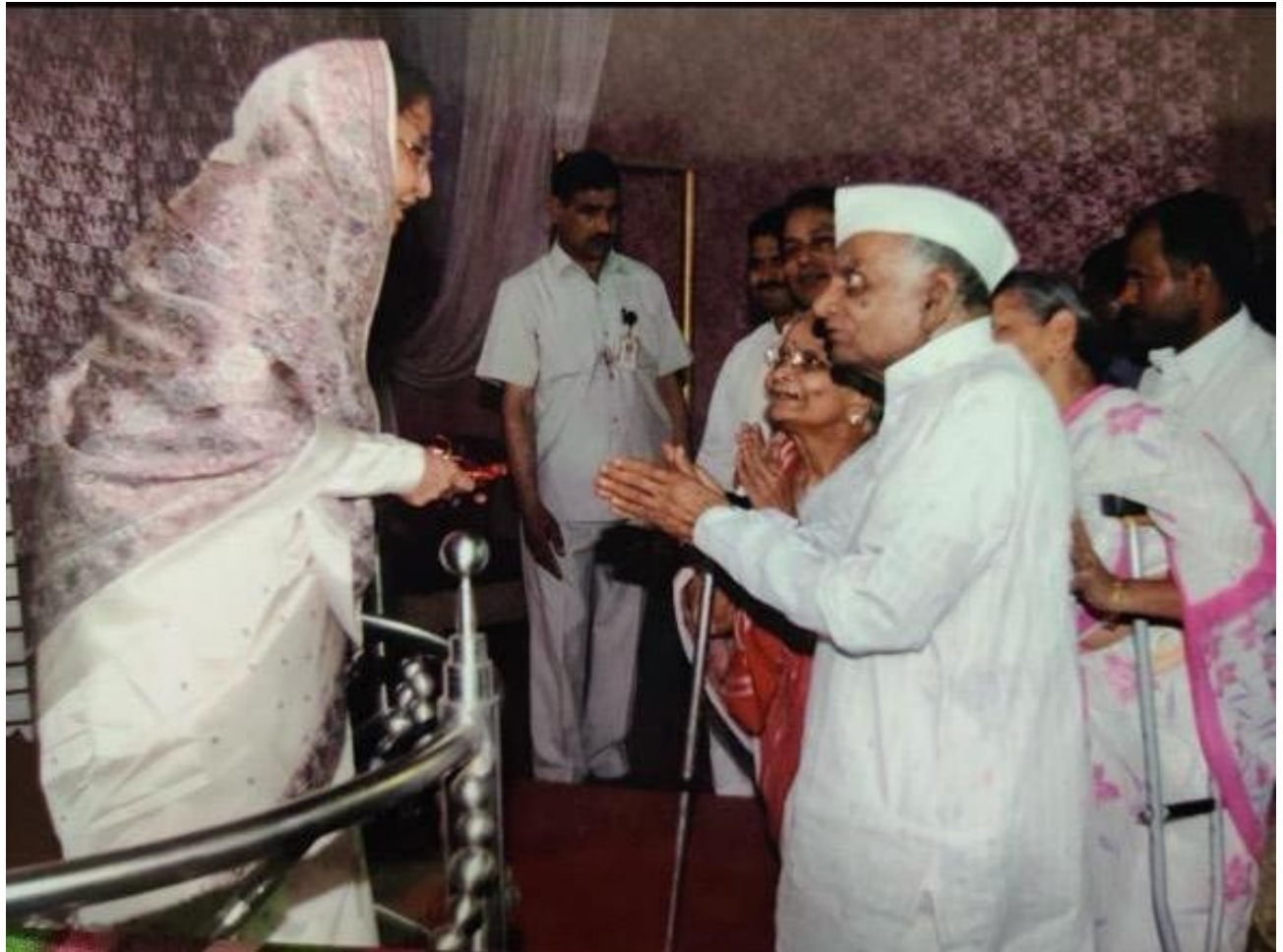
Presentation of the powada to President Pratibhatai Patil